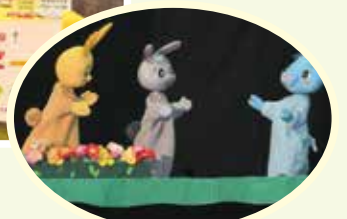
人形劇団「ねこじゃらし」