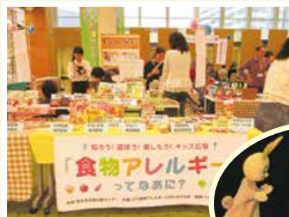
アレルギー除去食品展示

いつものように登録団体さんのブースと舞台では人形劇、マジック、紙芝居やエプロンシアターなど、また食物アレルギーのコーナーでは、イオンも含めて23社のサンプルが並び、相談コーナーもあって、多くの市民が関心をもって立ち寄られていました。台風21号直撃の最中の開催でしたが、何とかいつもの賑わいの中、少し早めの終了となりました。