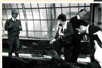
生ごみの堆肥化施設 (ハザカプラント) 見学〔宮城県〕2008年10月

【目的】 持続可能な社会を目指し、人の健康や地球環境を修復するために微生物に注目して、ともに学び、行動する。微生物浄化で CO 2 を大幅カットする。